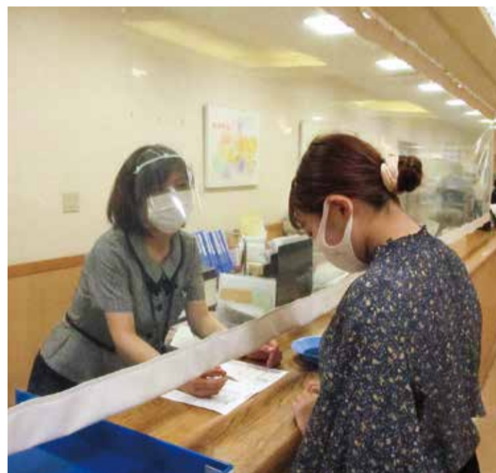
患者さんと一緒に確認

毎年7月を岡山医療生協医療安全月間として安全活動の取り組み強化を行っています。岡山協立病院では、今年度、患者誤認(患者間違い)防止対策として実践していた「患者確認方法」の見直しを行いました。