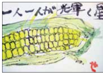
岡山市東区 九条 西水

「ザ・クロスワード」は、ボケ防止のためになると、一生懸命考えて楽しみながら解いています。